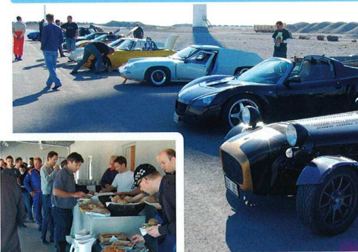
En brokig, lättviktig skara! Banåka kräver bankåka, vilket det fanns gott om.

Kvällen den 9 maj 2008 träffades ett 30-tal bilar med ett 40-tal förare i färjelägena Oskarshamn och Nynäshamn för att i grupp åka med Destination Gotlands färja över till Visby. Bland bilarna fanns bland andra Lotus Elise, Lotus Europa, Lotus Elan, Lotus Super Seven, Caterham, Westfield, Locost, Opel Speedster och Marcos. Vissa släpade sina klenoder på vagn, förmodligen visa av erfarenheten att både det ena och andra kan hända. Förvånansvärt många sätter emelertid en ära i att kunna transportera sig själv, två extra bensindunkar, fyra extrahjul, 30 kg verktyg och reservdelar och kläder för två dygn i sin lilla bil.