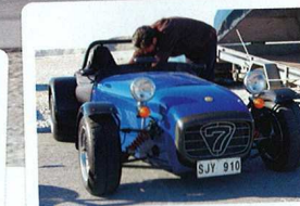
En läcker Caterham Seven till, den här med tilltalande accenter i kolfiber.

Logistiken måste också fungera så att det blev enkelt att boka, se vilka som skulle komma, få information om vad som gäller och svar på alla frågor. Kort sagt – ordning och reda. Den