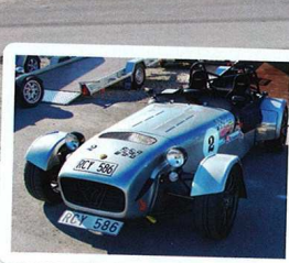
Artikelförfattarens, träffarrangörernas och Caterhamägarens Caterham CSR200.

SEDAN DESS har det blivit ett tiotal track days med olika arrangörer fram till hösten 2007, då jag bestämde mig för att själv ordna en track day så som jag själv skulle vilja ha den. Först och främst att det mestadels var likasinnade med likartade bilar – lätta bilar,