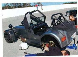
Fix och koll – en självklar del i Sevenlivet och särskilt inför några tuffa varv.

TEXT STEFAN HASSELGREN